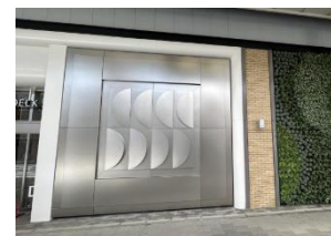
TOKUYAMA DECK 銀座通り側のモニュメント