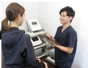
↑ 痛みの原因を根本から探っていきます！