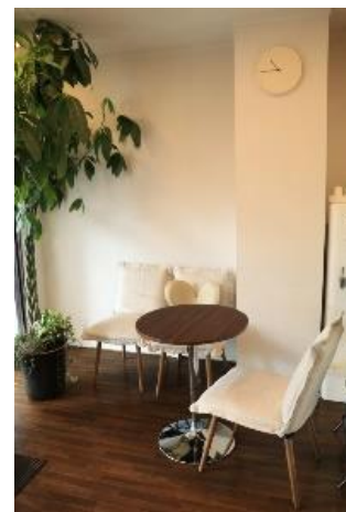
↑ 待ってる間もリラックスできる雰囲気です。

法人契約をしてくださる事業所を募集中しています。従業員さんの福利厚生にいかがですか？30分のトレーニング又は整体で利用できるお得な回数券をご用意しています。