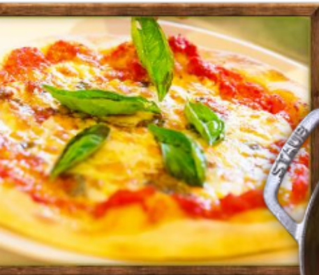
ーやっぱりピザは外せません マルゲリータ(¥1,100)

人気メニューはピザ、パスタ、ストウブ料理。ストウブ料理とは厚手の鍋で蒸し焼きにした料理です。無水で調理でき、素材の旨味を逃がしません。アツアツのままテーブルまでお持ちします！