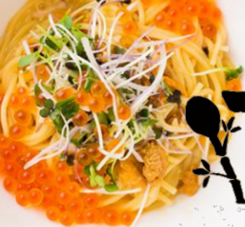
雲丹とイクラの生パスタ(¥1,680)