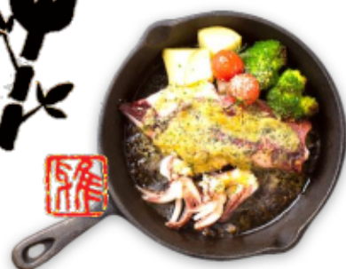
萩産ヤリイカのガーリック焼き