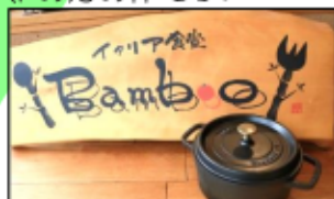
↑入口の木製の看板が素敵です