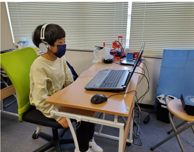
「聴覚刺激を利用した集中力向上トレーニング」

低下している脳のパフォーマンスを多角的なトレーニングで改善・向上を目指したサービスです。