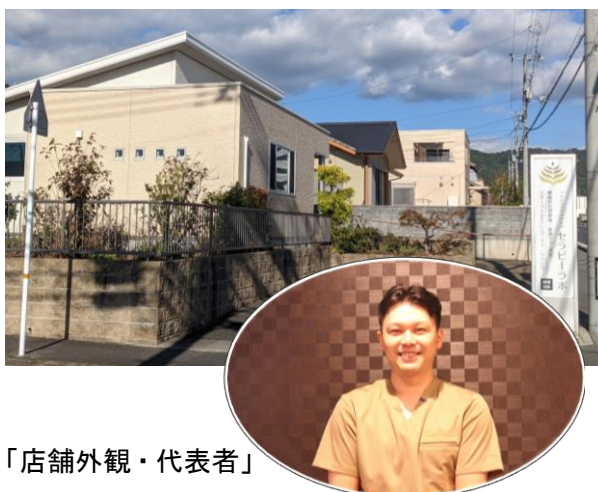
「店舗外観・代表者」

体の悩みに困っている方がどこにいけばよいか分からない、何をしたらよいか分からないという声を病院という臨床の現場で聞き続けていました。そんな方々の不安を少しでも減らすことが出来たらと思い整体院という形で店舗を作りました。医学の発達で日本の平均寿命は大幅に伸びてきています。しかし、人生百年時代ともいわれている中で健康寿命（元気に動いている期間）が短いというのが現状です。そのような状況で少しでも健康や予防として地域の方々の力になれることがあると思い行動をしました。また、リハビリ専門職である理学療法士が地域で活躍できる環境が作ることが出来たらと考えています。日本の保険範囲内だけでは足りないことはたくさんあると思います。保険だけに頼らずご自身の「健康」について考えて頂ける場所や時間が作れたら良いと考えています。怪我や病気をした後では遅いという事をしっかりと伝えていきたいと考えています。 私一人の力では小さいかもしれませんが、体の悩みが少しでも減り、体が改善できる環境がある地域作りが出来たらと考えています。今後は、保険適用となる訪問看護ステーションや体の悩みに特化したリハビリ事業を展開出来たらと考えています。人間のライフサイクルに合わせた店舗を展開したいと思います。「必要性」「価値」を感じてもらえるよう展開をして、体で悩んでいる方や困っている方のお手伝いが出来たらと考えています。