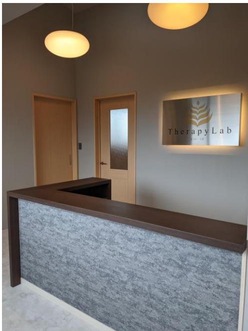
「こだわりの店内 待合室」