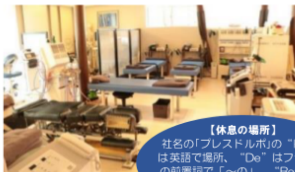
↑ 明るく広い院内に最新治療器が並んでいます。

そういった経験から、社訓は「人と施術に感動を〜継続は力なり、努力の先にチャンスあり〜」。従業員の控室に掲示し、毎日読んでいます。努力をしていないとチャンスはやってこない！と実感したからだとか・・・耳が痛いっ！