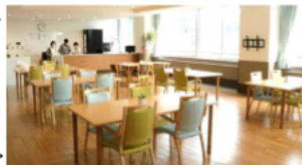
広くて明るい共有スペース

周南の工場群を見渡せる5階に位置しています。ご見学は予約なしでも可能です。要介護1以上の方が対象です。全部29室。病院に併設なので、何かの時にもすぐに対応できます。患者さんもご家族もとにかく安心です。