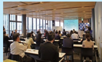
昨年の発表会風景