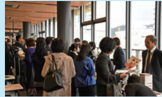
参加者との交流タイム