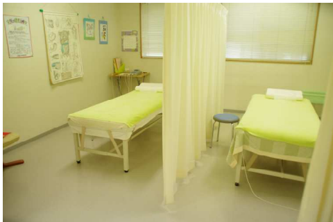
▲清潔な院内。ほのかなアロマの香りでリラックスできます♪

他にもアロママッサージのメニューもあります。また、体調不良時の食事についてアドバイスもしています。