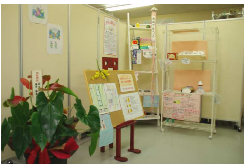
▲待合室も明るくゆったりしています。無料の水のサービスも嬉しいですね。