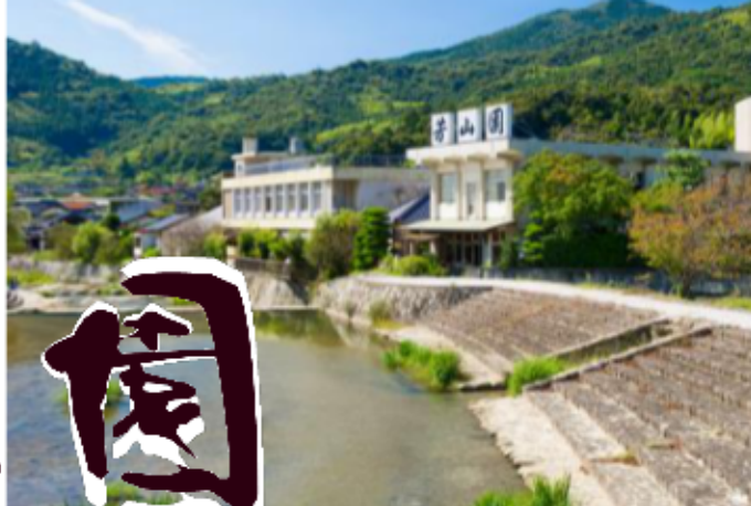
桜の咲く川沿いに佇む芳山園。夏にはホテルも飛び交います。