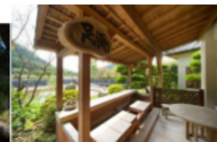
レストラン「花水木」の奥にある“足湯”