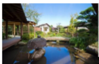
庭園の池の上にかかる環り廊下。天気の良い日は特に気持ちいいですよ。

現在、露天風呂での寝湯やサウナ、気泡風呂、水風呂などのある新しい温泉施設を増設しています。立ち寄り湯が今まで以上に利用しやすくなります。乞うご期待！