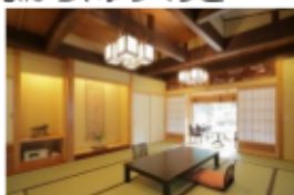
木にこだわった離れ和楽亭の幸(さち)

お料理の味もこだわりの一つ。戸田の漁港で水揚げされた「たこ」を使った「たこ釜飯」は昔からの味を守り、名物の一つです。