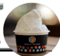
すだいだいを使ったジェラート(税込¥300)

現在、lineでお友達登録していただいた方の中から抽選でこのジェラートが当たるキャンペーンを開催中！数に限りがあります。ご応募はお早めに！