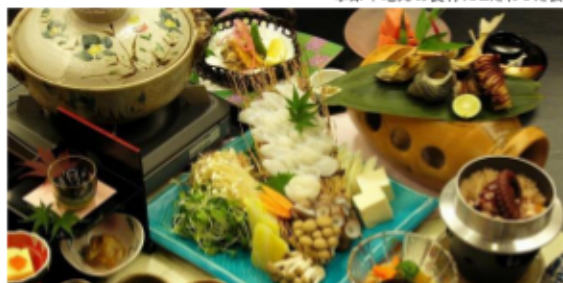
季節や地元の食材にこだわった会席料理

レストラン「花水木」では軽食をご提供しています。また、ご予約いただければ、天ぷら御前、お刺身御前、たこ釜飯御前など、ご宿泊いただかなくてもお召上がりいただけますよ♪